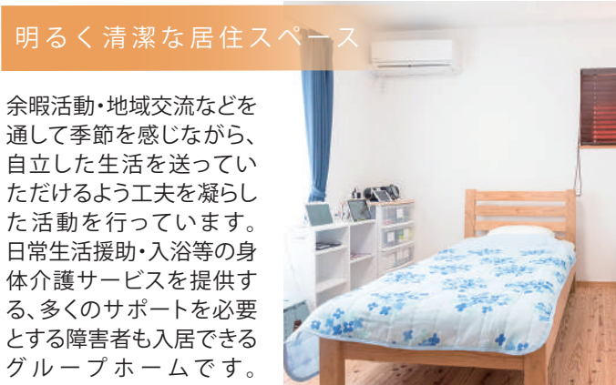
明るく清潔な居住スペース

余暇活動・地域交流などを通して季節を感じながら、自立した生活を送っていただけるよう工夫を凝らした活動を行っています。日常生活援助・入浴等の身体介護サービスを提供する、多くのサポートを必要とする障害者も入居できるグループホームです。