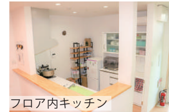
フロア内キッチン